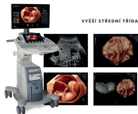
Voluson S8 touch